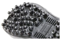
鉄ピンスパイクモールド

地下足袋にスパイク底で抜群の踏ん張り力！特に草の生茂った斜面などでその効果を発揮。強度のある鉄芯入で危険な作業から足先を防護！ナイロン入綿布採用で綿布面も丈夫。アップダウンの激しい場所で、踵部の衝撃吸収スポンジが足の負担を緩和。